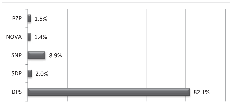
Grafik 2: Percepcija ishoda potencijalno održanih izbora

Postavlja se pitanje da li sistem sa predominantnom partijom u Crnoj Gori sadrži i ovaj elemenat, koji je iz perspektive motivacije birača prilikom glasanja iznimno važan. U empirijskom dijelu istraživanja ove teme, postavili smo biračima dva pitanja na osnovu kojih smatramo da možemo dokazati prisustvo imidža nepobjedivosti predominantne partije i u Crnoj Gori. Prvo pitanje je glasilo: „Ako bi se sutra održali izbori, koja bi partija pobijedila?” Grafik 2 prikazuje distribuciju odgovora na ovo pitanje: 82.1% birača iz našeg uzorka nema dilemu da bi na tim izborima pobijedila trenutno vladajuća partija.